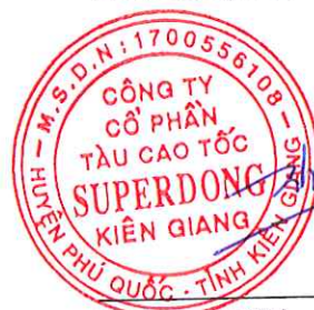
Hà Nguyệt Nhi Chủ tịch HĐQT

Báo cáo này phải được đọc cùng với Bản thuyết minh Báo cáo tài chính